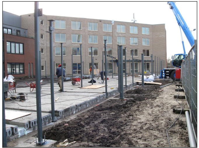
--- De uitbreiding van bejaardenhuis Rivierenhof aan de spoorzijde

Een belangrijk punt is dat Woonpartners zich heeft voorgenomen om de 'woonlasten' voor haar huurders te drukken, door middel van energiebesparende middelen. Alleen zal dit niet een-twee-drie bij al haar woningen zijn uitgevoerd.